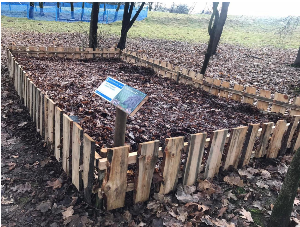
Ryc. 3. Przykładowe wykonanie przestrzeni dla jeży w Parku Tysiąclecia (bez nasadzeń).

Zamawiający wskazuje na konieczność przedłożenia do akceptacji wzorów wykonanych przestrzeni i tabliczek przed wbudowaniem poszczególnych elementów. Przed wbudowaniem materiałów Wykonawca zobowiązany jest do uzyskania akceptacji Zamawiającego dla materiałów przeznaczonych do wbudowania. W przypadku nie dotrzymania tego warunku Wykonawca dokona wymiany elementu lub materiału na własny koszt.