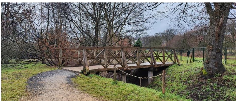
zdj. Nr 1,2. Widok mostku w Parku Młynówka Królewska