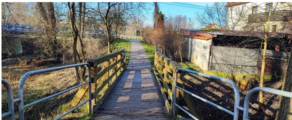
zdj. Nr 4,5. Widok mostku w Parku Białoprądnickim im. Tadeusza Kościuszki