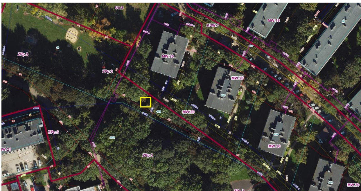
Lokalizacja nr 3: dz. nr 93/2 obr. 8 Nowa Huta – Planty Bieńczyckie