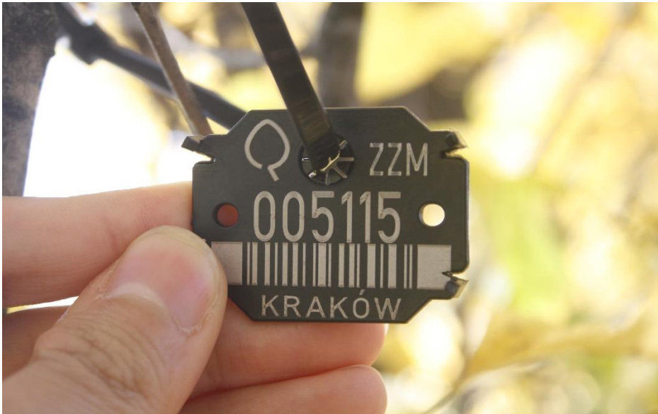
Sposób prowadzenia opaski.

3.2.11 Wokół systemu stabilizującego (opalikowania) drzewo, należy założyć etykietę zgodnie z rys. 4 wykonaną drukiem solwentowym na banerze 510g (materiał PCV). Wygląd etykiet oraz sposób montażu obrazują rys. 4-9.