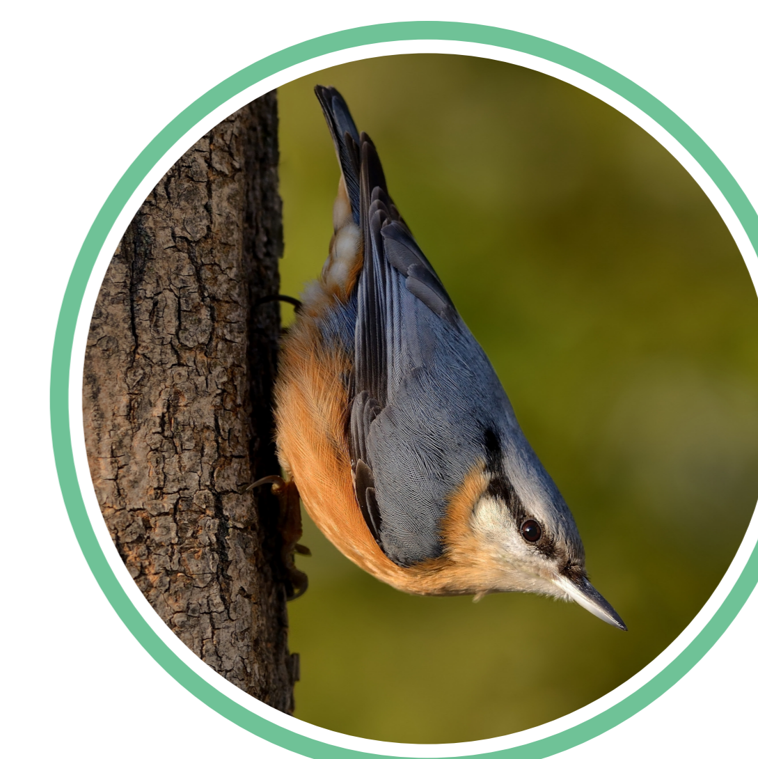
Kowalik zwyczajny ( Sitta europaea )