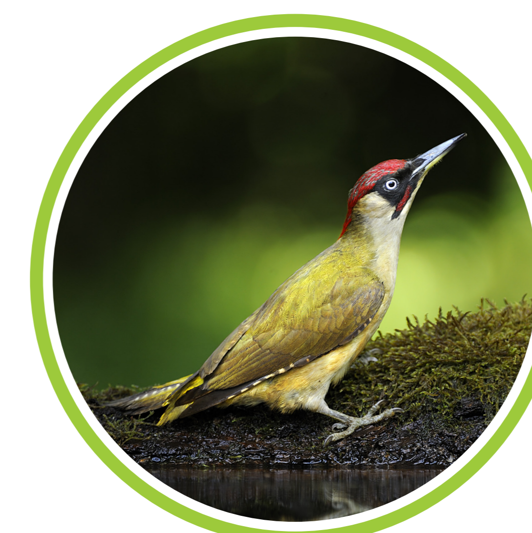
Dzięcioł zielony ( Picus viridis )